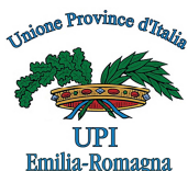
UPI Emilia Romagna

in collaborazione con la Fondazione Giovanni Astengo e il Patrocinio di: